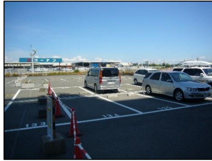
平面駐車場、右は来客者駐車場