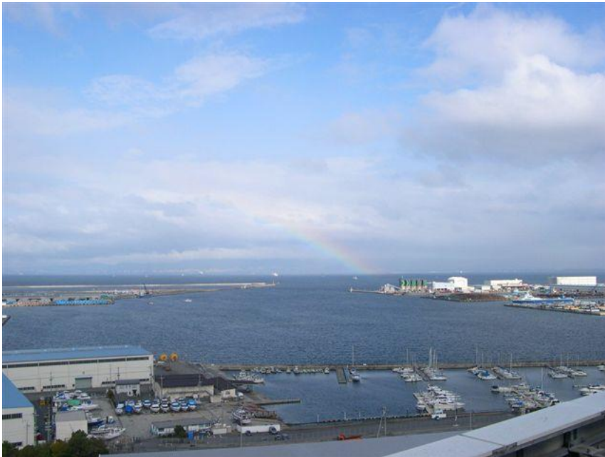
事務所からのビュー（一例）