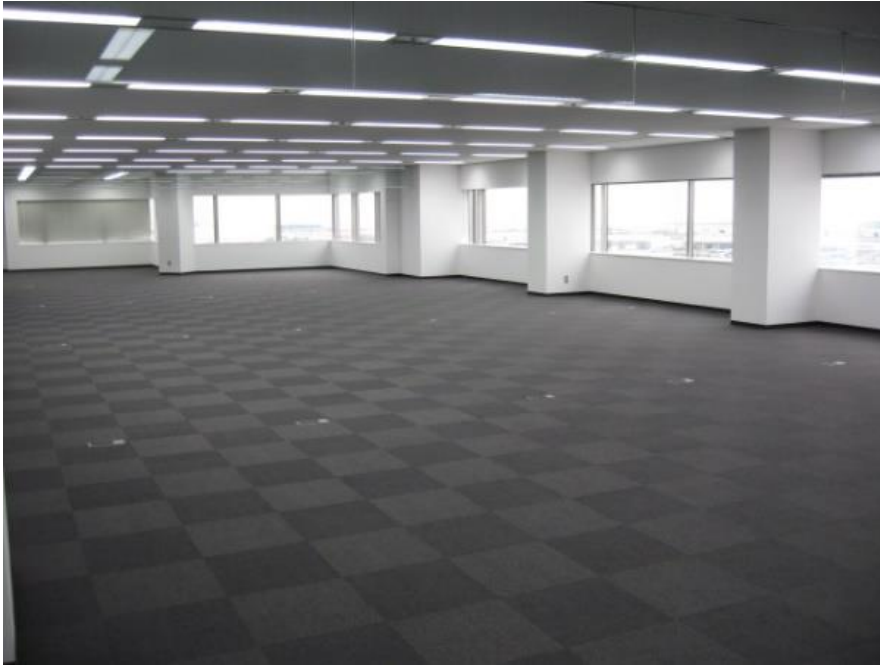
基準階事務所内装