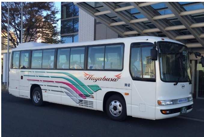
南海泉大津駅を往復するシャトルバス（無料）