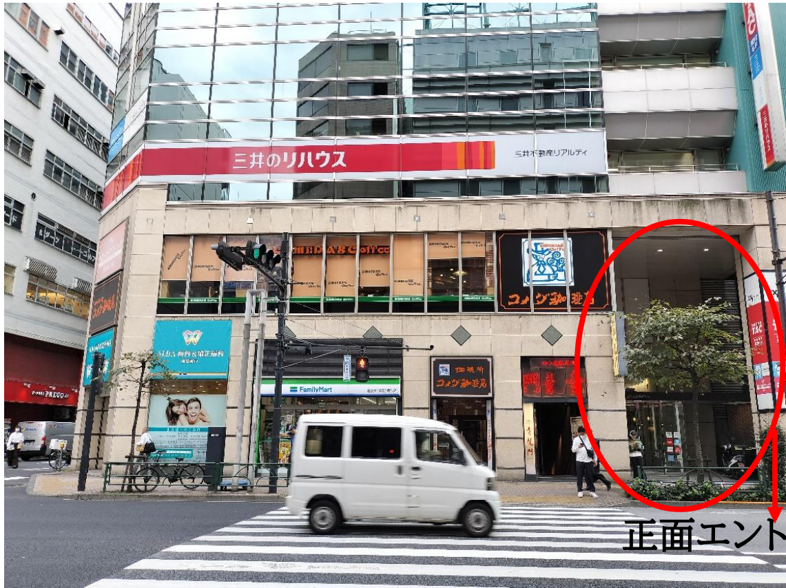
正面エントランス